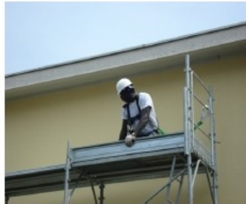
22) Chiudere la tavola con botola e proseguire nella sequenza