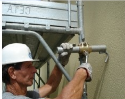
10) Montare gli ancoraggi al primo livello, secondo gli schemi del libretto di autorizzazione o come indicato nel progetto