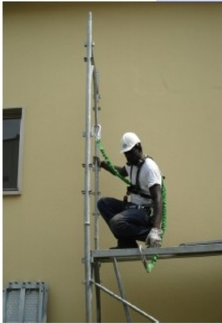
13) Assicurarsi al telaio montato e chiudere la tavola con botola