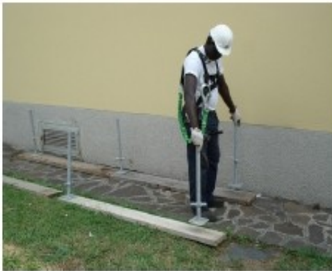
1) Posizionare le basette sulle tavole di ripartizione precedentemente disposte