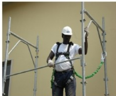
16) Montare i correnti