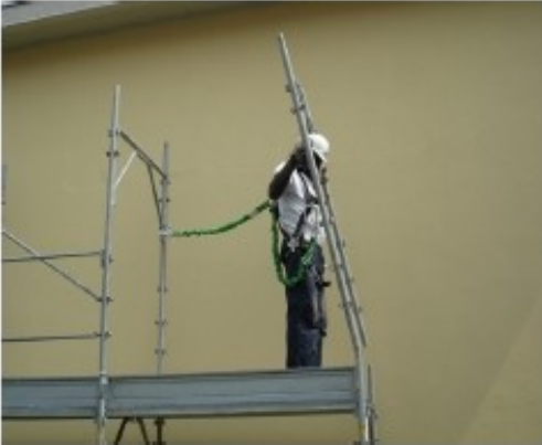
19) Assicurarsi al telaio successivo e proseguire la sequenza