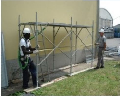
9) Allineare i telai e fissare le basette alle tavole in legno sottostanti