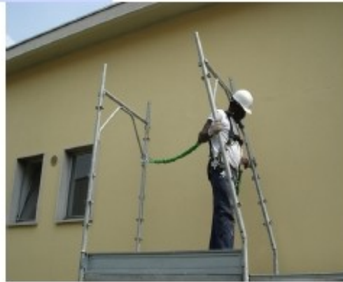
14) Infilare il telaio successivo