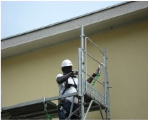
21) Montare il telaietto di testate e assicurarsi