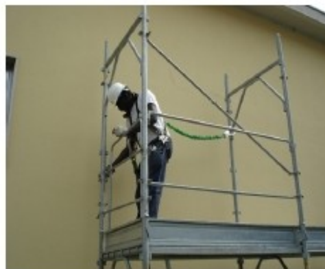
18) Montare il telaietto di testata