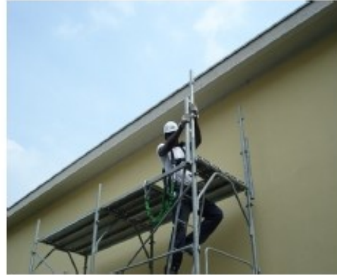
20) ULTIMO PIANO Assicurarsi alla tavola con botola, salire all'ultimo piano e infilare le aste di parapetto