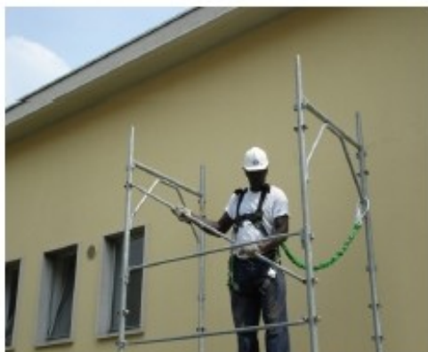
17) Montare la diagonale