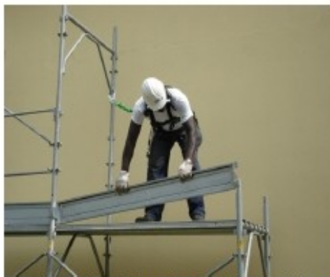
15) Completare l'impalcato con il fermapiede