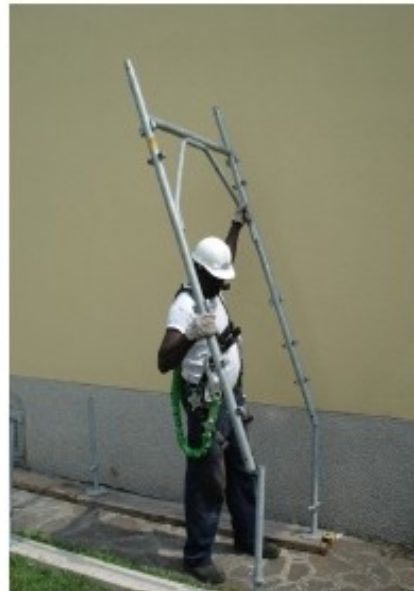
2) Infilare il primo telaio sulle basette