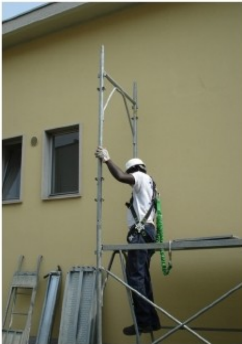
11) Assicurarci alla tavola con botola, salire al piano superiore e infilare il telaio